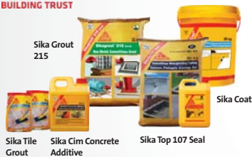
Sika Grout 215